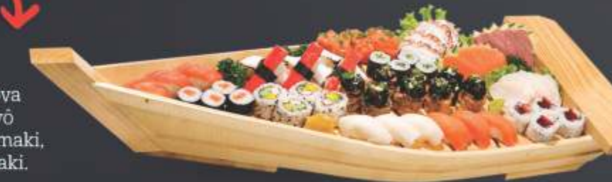
Combinado Hot and Roll Especial 62 unidades 5 sashimi de salmão, 5 sashimi de atum, 5 sashimi de tilápia ou anchova negra, 5 sashimi de polvo, 3 sushi de salmão, 3 sushi de atum, 3 sushi de tilápia ou anchova negra, 3 sushi de polvo, 3 sushi de kani, 3 jyô de salmão, 8 mini hot roll, 4 Califórnia uramaki, 4 goiabada uramaki, 4 kapamaki e 4 sakemaki.