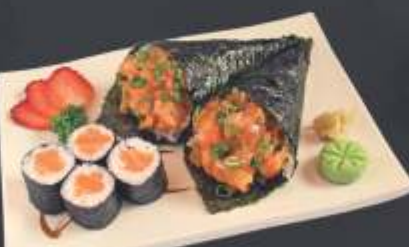
Executivo 11 - 6 unidades 2 mini temaki de salmão e 4 sakemaki.