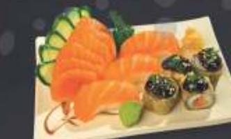
Combinado de Salmão 13 unidades 6 sashimi de salmão, 3 sushi de salmão e 4 mini hot roll.