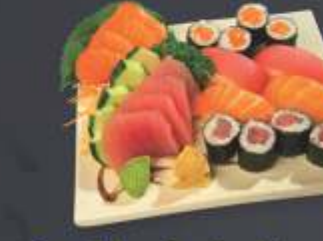
Combinado de Atum e Salmão 20 unidades 4 sashimi de salmão, 4 sashimi de atum, 2 sushi de salmão, 2 sushi de atum, 4 sakemaki e 4 tekamaki.