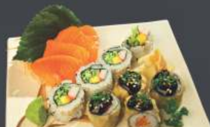
Executivo 7 - 12 unidades 4 sashimi de salmão, 4 mini hot roll e 4 Califórnia uramaki.