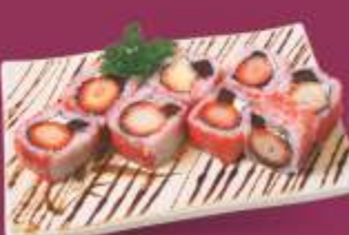
Goiabada Goiabada, cream cheese e morango