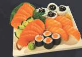
Combinado de Salmão Especial • 22 unidades 10 sashimi de salmão, 4 sushi de salmão, 4 sakemaki e 4 salmão skin uramaki.