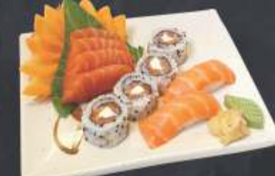
Executivo 6 - 10 unidades 4 sashimi de salmão, 2 sushi de salmão e 4 uramaki salmão com cream cheese.