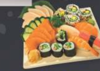
Combinado Misto Especial • 22 unidades 5 sashimi de salmão, 5 sashimi de tilápia ou anchova negra, 1 sushi de salmão, 1 sushi de tilápia ou anchova negra, 1 sushi de kani, 1 sushi de camarão, 4 Califórnia uramaki e 4 kapamaki.