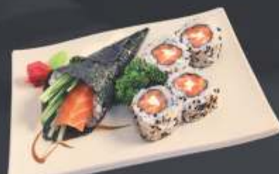
Executivo 12 - 5 unidades 1 mini temaki de salmão com pepino e 4 uramaki salmão com cream cheese.