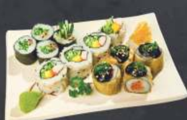
Executivo 5 - 12 unidades 4 kapamaki, 4 Califórnia uramaki e 4 mini hot roll.