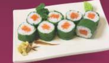
Salmão Couve Salmão, cream cheese e couve