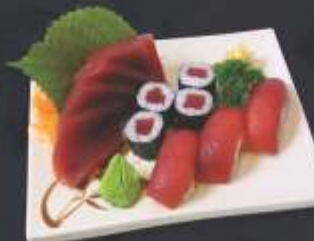
Combinado de Atum 12 unidades 5 sashimi de atum, 4 tekamaki e 3 sushi de atum.