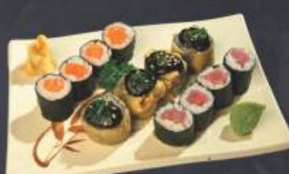
Executivo 8 - 12 unidades 4 sakemaki, 4 tekamaki e 4 mini hot roll.