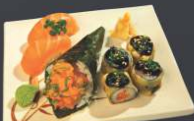
Executivo 10 - 7 unidades 1 temaki de salmão, 2 sushi de salmão e 4 mini hot roll.