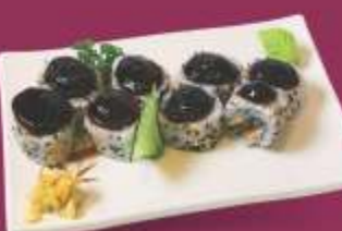
Salmão Skin Carne e pele de salmão grelhado e tarê