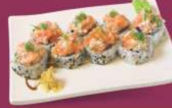
Salmão Cream Cheese Salmão, cream cheese e gergelim Opcional c/ Tataki de salmão