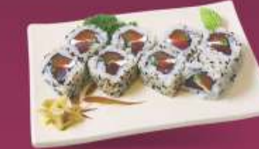
Salmão Atum Salmão, atum, cebolinha, cream cheese ou maionese