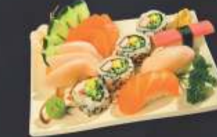
Combinado Misto • 13 unidades 3 sashimi de salmão, 3 sashimi de tilápia ou anchova negra, 1 sushi de salmão, 1 sushi de tilápia ou anchova negra, 1 sushi de kani e 4 Califórnia uramaki.