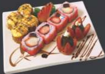
Executivo 1 - 10 unidades 4 uramaki goiabada, 4 hot roll mousse de maracujá e 2 morango brigadeiro.