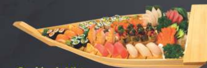
Combinado Misto para 3 pessoas • 57 unidades 5 sashimi de salmão, 5 sashimi de atum, 5 sashimi de tilápia ou anchova negra, 3 sushi de salmão, 3 sushi de atum, 3 sushi de tilápia ou anchova negra, 3 sushi de camarão, 3 sushi de kani, 3 jyô de salmão, 8 mini hot roll, 4 kapamaki, 4 sakemaki, 8 goiabada uramaki ou 8 Califórnia uramaki.