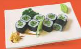
Kapamaki Pepino e gergelim

Enrolado fino de arroz envolto em alga com diversos recheios · Porção: 8 unidades / 4 unidades