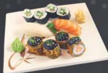
Executivo 2 - 10 unidades 1 sushi de salmão, 1 sushi de tilápia ou anchova negra, 4 kapamaki e 4 mini hot roll.