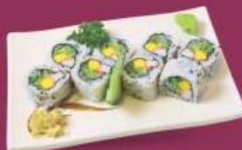
Califórnia Kani, pepino, manga e gergelim

Enrolado ao contrário com arroz por fora, com diversos recheios · Porção: 8 unidades / 4 unidades