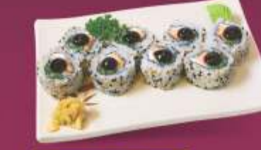
Salmão Furai Salmão empanado, pepino, cebolinha, cream cheese, pimenta, gergelim e tarê