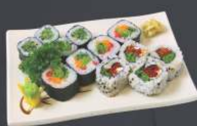
Executivo 3 - 12 unidades 4 tomate seco uramaki, 4 kapamaki e 4 futomaki vegetariano.