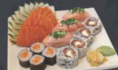
Executivo 9 - 16 unidades 5 sashimi de salmão, 3 sushi de salmão maçaricado, 4 uramaki salmão com cream cheese e 4 sakemaki