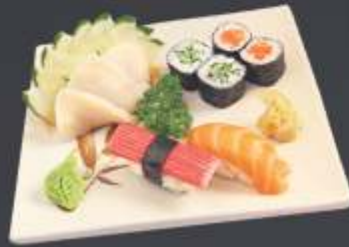
Executivo 4 - 10 unidades 3 sashimi de tilápia ou anchova negra, 1 sushi de salmão, 1 sushi de kani, 2 kapamaki e 2 sakemaki.