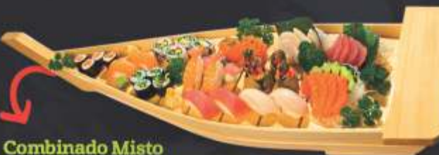
Combinado Misto para 2 pessoas • 40 unidades 4 sashimi de salmão, 4 sashimi de atum, 4 sashimi de tilápia ou anchova negra, 2 sushi de salmão, 2 sushi de atum, 2 sushi de tilápia ou anchova negra, 2 sushi de camarão, 2 sushi de kani, 2 jyô de salmão, 4 mini hot roll, 4 kapamaki, 4 sakemaki e 4 goiabada uramaki ou 4 Califórnia uramaki.