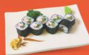
Kanimaki Kani, pepino e gergelim